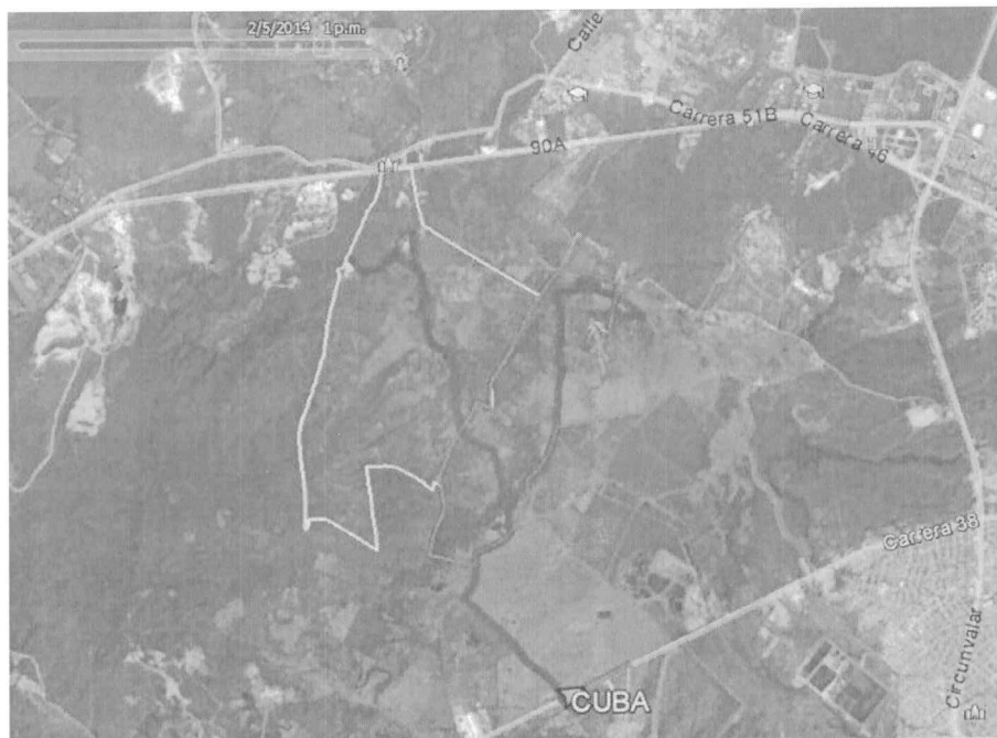
Recorrido de Campo a los predios Cuba y Casa Blanca (Google Earth)